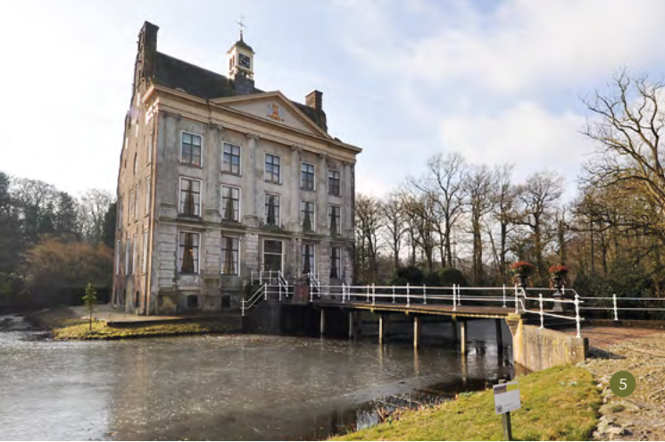
Het Landgoed van Kasteel Ter Horst ligt midden in het bekenstelsel.